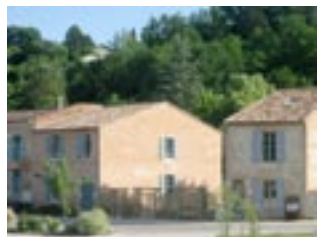
Le Moulin à Nef

Connaissez-vous des groupes ou des individus qui s'intéresseraient à louer les ateliers du Moulin à Nef quand nos artistes ne sont pas en résidence? Donnez-leur nos coordonnées! Notre brochure est disponible sur demande. 1-434-946-7236, vcca@vcca.com .