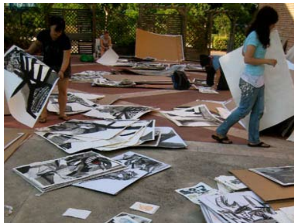
Les étudiants du YSS@ISS dans la cour du Moulin à Nef, 2009 YSS@ISS "Studio Practice" workshop.

Auvillar et l'ambiance de la mission du VCCA comme havre pour le travail de studio des artistes offrent un environnement idéal pour les objectifs de YSS@ISS. Isolé durant la plupart de la session, le programme se dévoile à la communauté d'Auvillar lors de la dernière semaine, intitulée "REPRÉSENTATIONS". Il offre des expositions, des conférences par les étudiants, des vernissages et la participation d'invités. C'est le point culminant de quatre semaines d'études rigoureuses qui permettent d'établir le lien entre la création réelle et la compréhension des procédés créatifs employés dans de nombreuses disciplines.